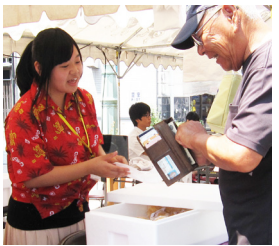
「ありがとうございます」が、響きましたね。