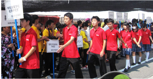
タッタカターで行進だ!