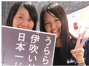
EGAO egao 笑顔 えがお エガオ