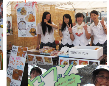
手書きで 頑張りました。