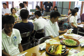
安芸料理を楽しみました。